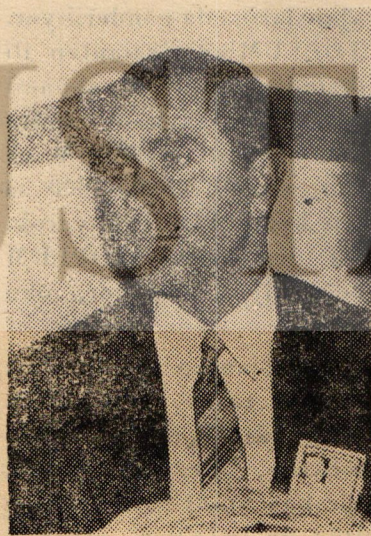
MİLLÎ DAMAT TOKER

Anayasaya göre, partiler, rejimin vazgeçilmez unsurudur. Dayağa gelince dayak ta açık rejimin ve İsmet Paşa demokrasinin vazgeçilmez bir inceliğidir. Son günlerde şehirde ce reyan eden, biz diyelim 70 siz deyin 100 hırsızlık olayının sorumlularını tutamayan polis, gerçeklere gözünü (Devamı 4 de)